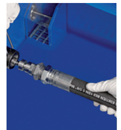
ADAPTORS WITH QUICK COUPLING ADATTATORE CON INNESTO RAPIDO BC 1200/E