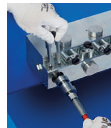
ADAPTORS WITH QUICK COUPLING ADATTATORE CON INNESTO RAPIDO BC 1200/E ES